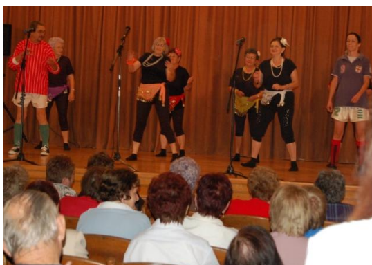
Idősek Klubja, Egyházásrádóc