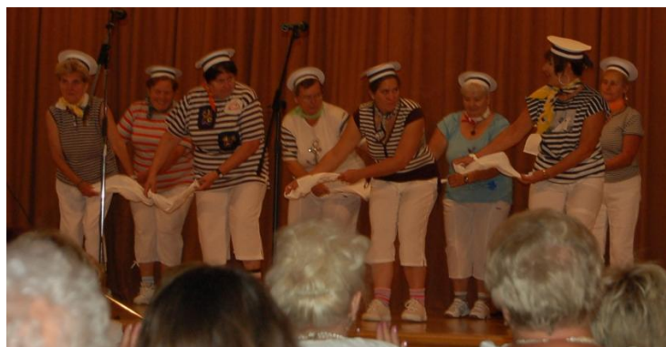
Népjóléti Szolgálat II. sz. Idősek Klubja, Celdömölk

A bemutatkozások során kialakult vidám, felszabadult hangulat katartikus élményt váltott ki a szereplőkben és a nézőkben egyaránt, melyről elmondható, hogy jótékony hatással bír a test, a lélek, a szellem teljesítőképességére. Az önkifejezés iránti vágy enyhíti a testi panaszokat, a színpadon történő önfelelt mozgás és a tánc feledteti a testi fájdalmakat, energetizál, segíti az öngyógyulást és az életerő visszanyerését. A verses és prózai előadások szellemileg felfrissítenek, serkentik a gondolkodást, az emlékezetet, a beszédképességet, a figyelmet és a képzelőerőt, aktivizálják az érzelmeket, felszínre hozzák az örömképességet és elősegítik a pozitív gondolkodást. A közösségi együttlét kedvezően befolyásolja a közérzetet, fokozza az életkedvet, belső egyensúlyt teremt, levezeti az indulatokat, oldja a felgyülemlett feszültséget és elűzi a negatív gondolatokat.