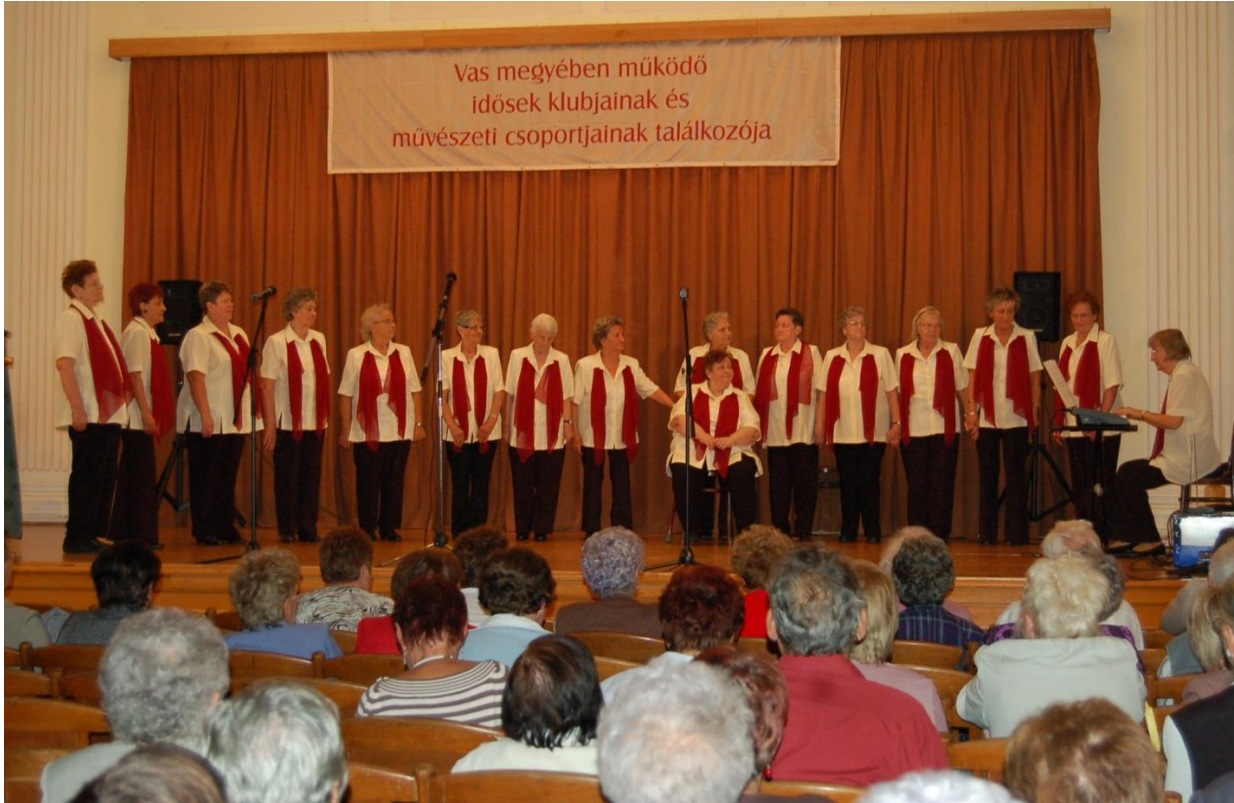
Őszirózsák Kórus, Pálos Károly Szociális Szolgáltató Központ és Gyermekjóléti Szolgálat II. sz. Idősek Klubja, Szombathely

A program végén a fellépők és a közönség együtt énekelték el a „Mindenik embernek a lelkében dal van” című nótát. A szereplők esztétikai élményekkel gazdagodva térhettek haza, még inkább nyitottá váltak a különféle művészetek befogadására. Vágyukat fejezték ki hasonló közösségi élmények átélésére és megtapasztalására. „Jövőre ugyanitt!” felkiáltással köszöntek el többen is.