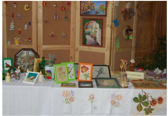
Művészeti alkotások a kiállítóterben