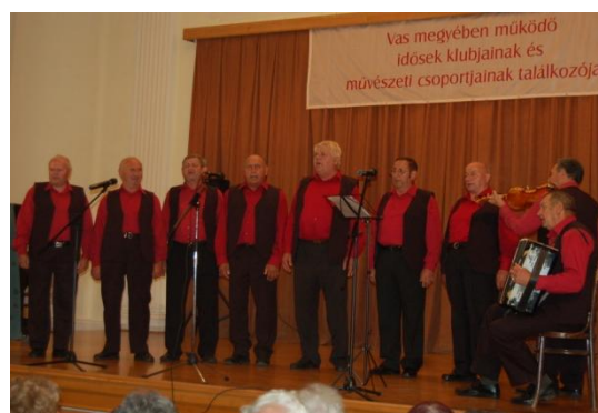
Alistáli Nyugdíjas Népdalkör, Szlovákia