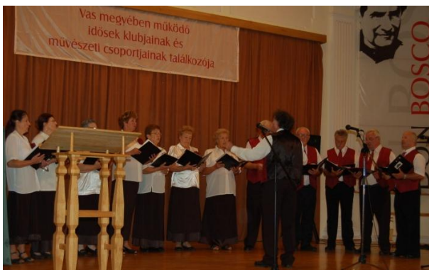
Aranykorúak Vegyeskara, Szombathely

A bemutatkozások során kialakult vidám, felszabadult hangulat katartikus élményt váltott ki a szereplőkben és a nézőkben egyaránt, melyről elmondható, hogy jótékony hatással bír a test, a lélek, a szellem teljesítőképességére. Az önkifejezés iránti vágy enyhíti a testi panaszokat, a színpadon történő önfelelt mozgás és a tánc feledteti a testi fájdalmakat, energetizál, segíti az öngyógyulást és az életerő visszanyerését. A verses és prózai előadások szellemileg felfrissítenek, serkentik a gondolkodást, az emlékezetet, a beszédképességet, a figyelmet és a képzelőerőt, aktivizálják az érzelmeket, felszínre hozzák az örömképességet és elősegítik a pozitív gondolkodást. A közösségi együttlét kedvezően befolyásolja a közérzetet, fokozza az életkedvet, belső egyensúlyt teremt, levezeti az indulatokat, oldja a felgyülemlett feszültséget és elűzi a negatív gondolatokat.